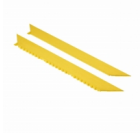
552 MD-X Ramp System™ Nitrile